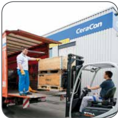
Verladen von beschäumten Bauteilen