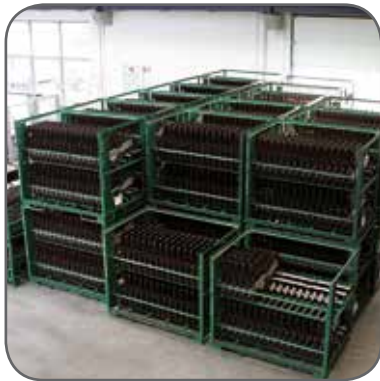
Lagergestelle mit zu beschäumenden Türmodulträgern