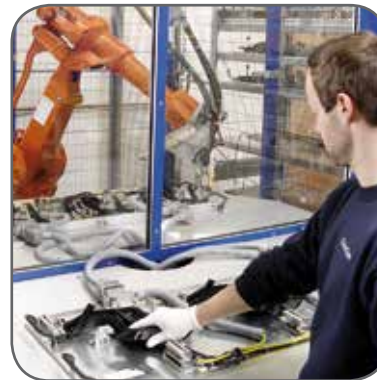
Beschäumen von Lampenträgern an einer automatisierten Roboterzelle