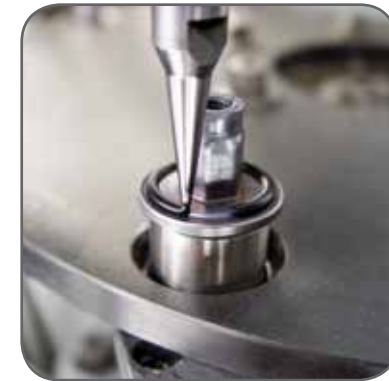
Automatisiertes Beschäumen von Gewindebuchsen im 3-Sekunden-Takt